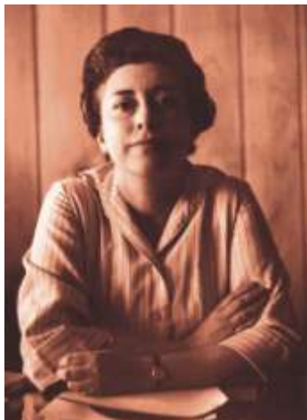
Rosario Castellanos Figueroa

en 1864. Para 1867 es electo nuevamente Gobernador Constitucional, durante su prolongada administración se expidieron Leyes sobre educación, hacienda y comunicaciones, falleció el 8 de febrero de 1894.