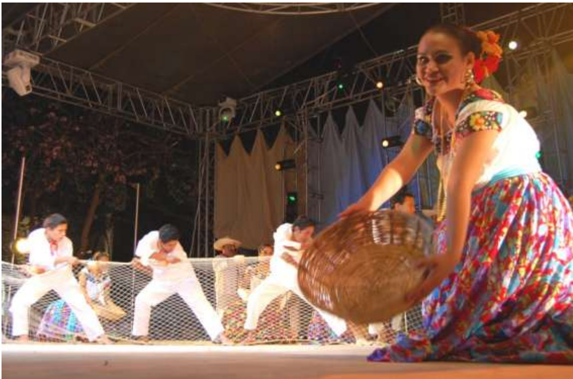
Festival Internacional Rosario Castellanos.

Que se lleva a cabo del 10 al 20 de enero, días en que se festeja al Santo Patrono y dentro de las actividades que se organizan se incluyen las corridas de toros.