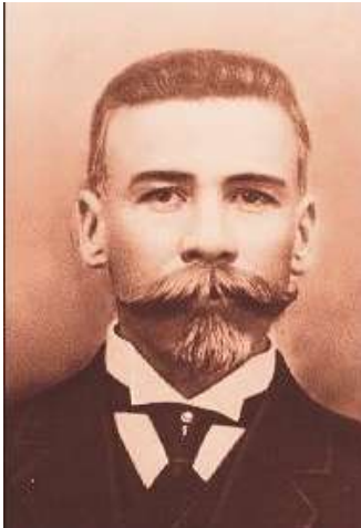
Belisario Domínguez Palencia.

Nació en Comitán el 25 de abril de 1863. En 1879 marchó a París para cursar sus estudios profesionales donde recibió el título de Médico Cirujano y Partero. En 1890 llega a Comitán y para 1909 fue electo Presidente Municipal, su buena gestión le da acceso a participar en las elecciones de 1912 al Senado de la República. El país pasaba por momentos de inestabilidad con la muerte del presidente Francisco I. Madero y la del Vicepresidente José María Pino Suárez a manos del victimario y traidor Victoriano Huerta. En medio de tanto desorden y muerte como era normal, el Dr. Belisario Domínguez colaboró en la labor humanitaria de la Decena Trágica.